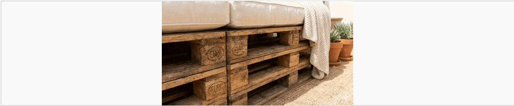
Détail de l'assemblage brut avant finition