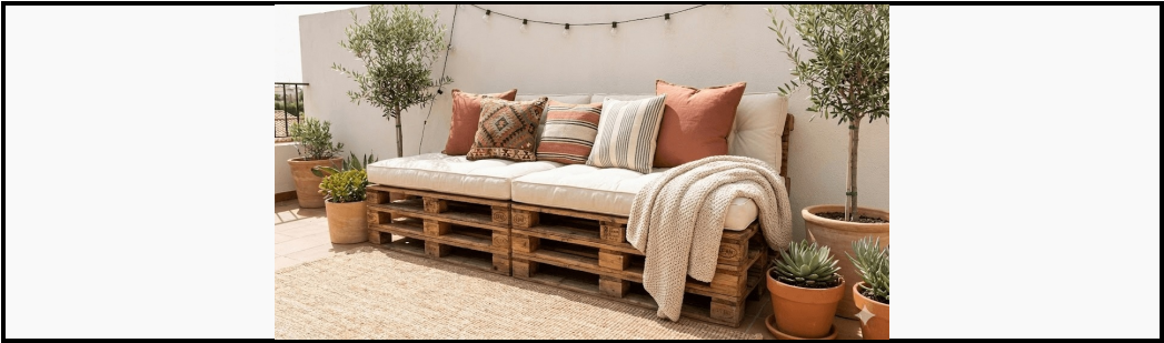
Rendu final avec coussins et décoration

✓ CONTRÔLE FINAL : Vérifier stabilité, serrage vis, absence échardes. Ce plan est fourni à titre indicatif. Vérifiez la solidité avant usage. FIN DU DOCUMENT