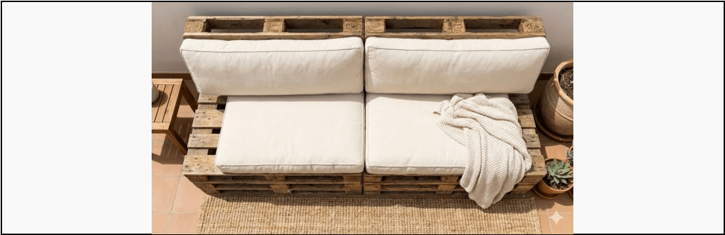
Vue de dessus - Disposition des palettes (240×80 cm)